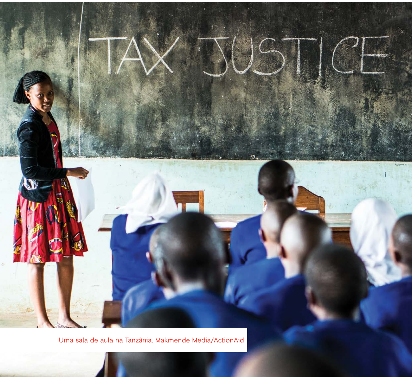
Uma sala de aula na Tanzânia

Para que a educação seja aceitável e adaptável , precisa de ser relevante . Isto significa que tem de ser ensinada na língua materna e ligada às realidades locais, mas isto não significa que precisa de empregar “localismos”. Há um interesse universal em assegurar que as meninas e os meninos recebem instrução sobre os seus direitos de saúde sexual e reprodutiva, são apoiados para fazerem escolhas positivas através da formação em competências de vida e que estão preparados para a cidadania activa e o pensamento crítico.