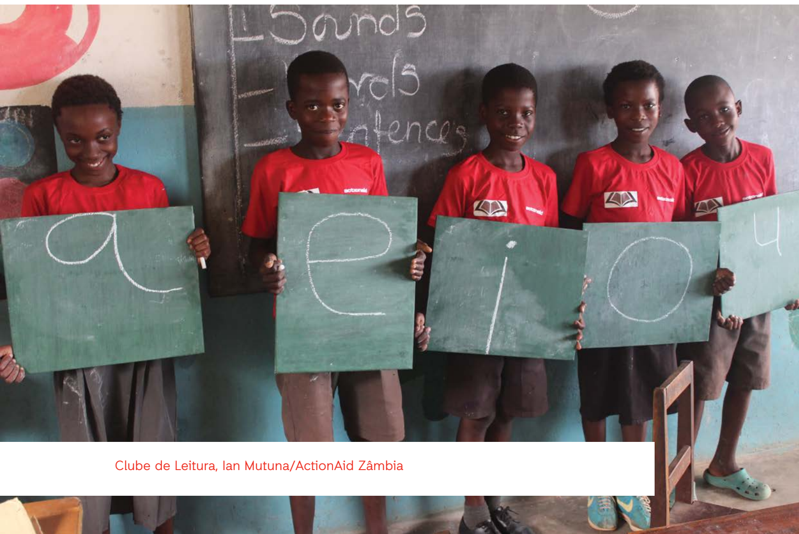
Clube de Leitura

Meninas e meninos têm o mesmo direito de participar de modo significativo na tomada de decisões nas escolas. Seguir pessoas que falam em fóruns importantes e cuja voz é bem ouvida, pode ajudar a que os preconceitos sejam reduzidos. A participação das crianças, especialmente das meninas ou crianças de grupos marginalizados, em espaços democrático nas escolas pode constituir a base para a participação e liderança significativas numa sociedade mais vasta.