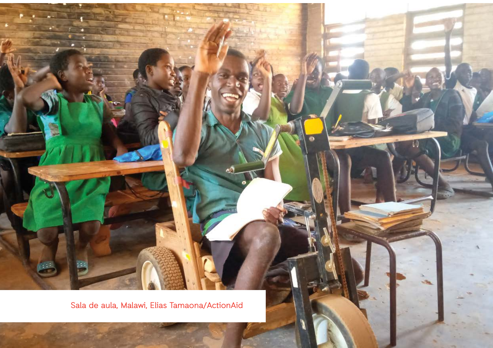
Sala de aula, Malawi

Deveriam também ajudar a determinar se os pais das crianças que sofrem de discriminação são devidamente apoiados.