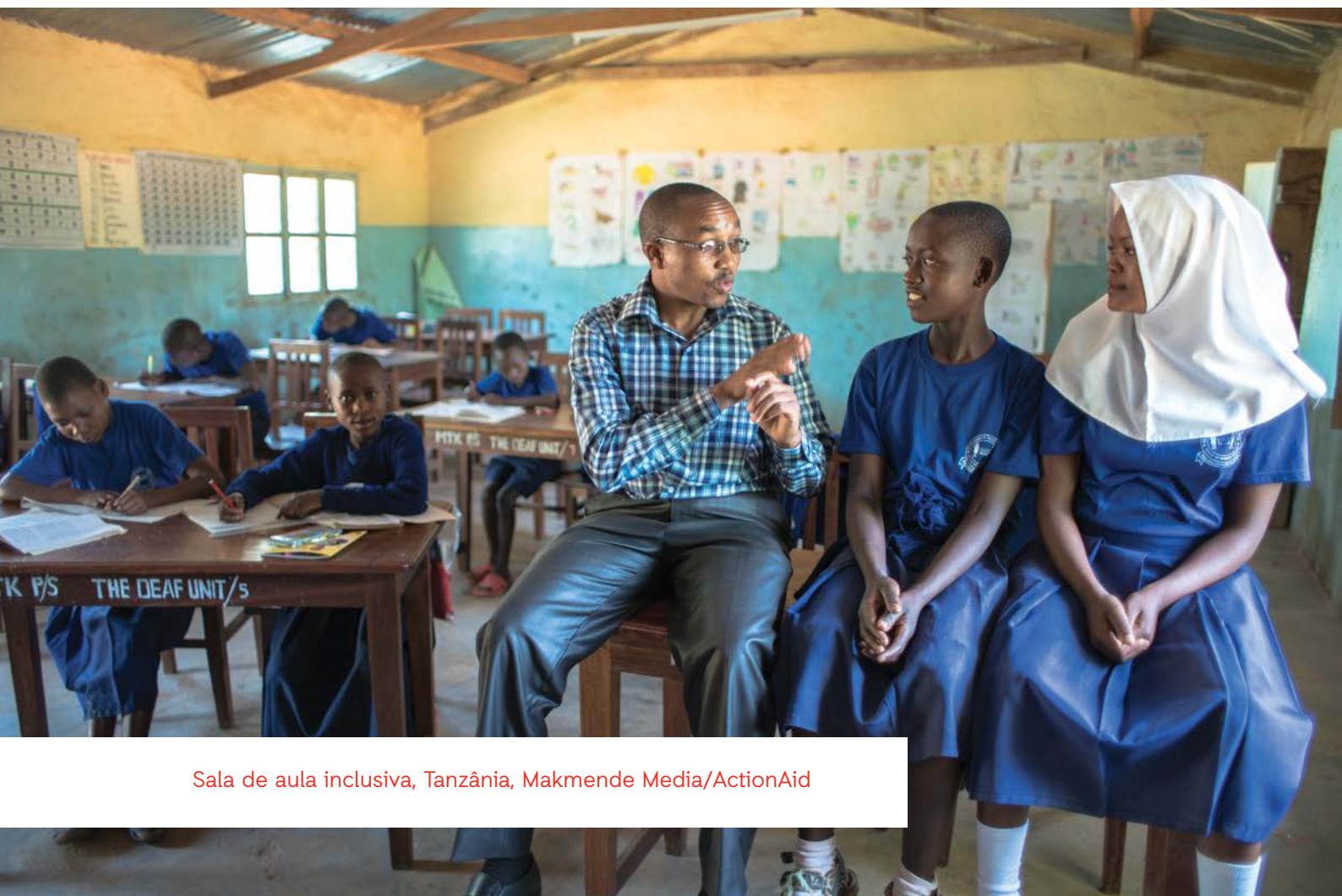
Sala de aula inclusiva, Tanzânia

Quando as infra-estruturas escolares são inadequadas, as meninas são muitas vezes, as primeiras a ser afectadas. Por exemplo, no caso de instalações sanitárias, a menos que existam instalações seguras, decentes e separadas para meninas e meninos, o resultado pode ser afastar as meninas da escola, seja de forma permanente, seja temporariamente (por exemplo, durante o período da menstruação). Onde existem normas nacionais mínimas para provisão de saneamento, estas devem ser aplicadas. Todas as instalações sanitárias devem, pelo menos, cumprir as normas mínimas definidas a nível mundial para saneamento escolar e WASH, i.e. as normas mínimas de SPHERE (ver o Anexo 6).