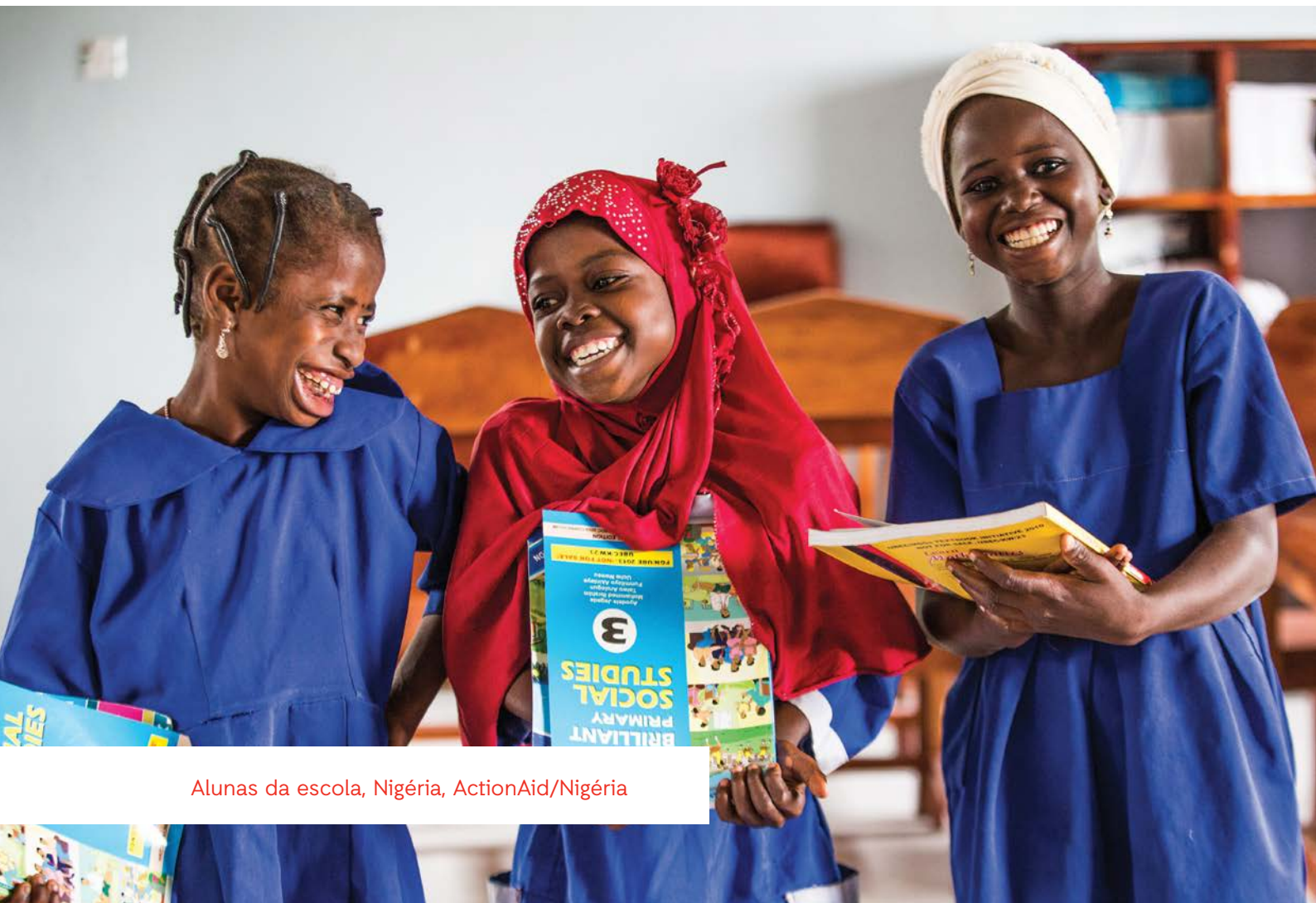
Alunas da escola, Nigéria