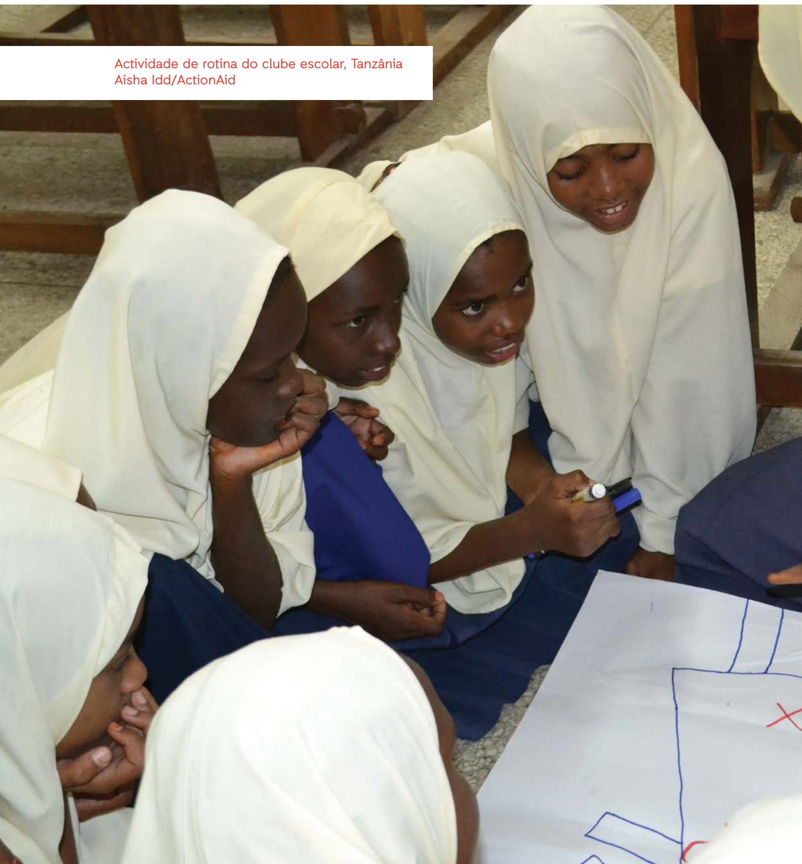
Actividade de rotina do clube escolar, Tanzânia

Com esta informação, é possível aumentar a conscientização da comunidade sobre os dez direitos e incentivar o envolvimento das partes interessadas. Isto pode significar, p.ex., o trabalho com as partes interessadas locais, a produção de cartazes, folhetos ou outras mensagens de sensibilização relevantes incluindo as redes tecnológicas e sociais, quando relevantes ou práticas. É importante reflectir sobre o tipo ou estilo de mensagens que melhor incentivarão o envolvimento das autoridades tradicionais e instituições governamentais.